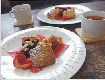
赤毛のアン モンゴメリ 作 / 村岡花子 訳 ポプラ社 グリーン・ゲイブルスのお茶会 レイヤーケーキ・パイ2種とビスケットに紅茶付 午後2時～注文に応じます 1,290円(税込)