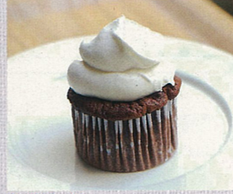
カップケーキのパニラクン シャリース・ミキのパンパ 二宮由紀子 訳 BL出版 カップケーキ 300円(税込)