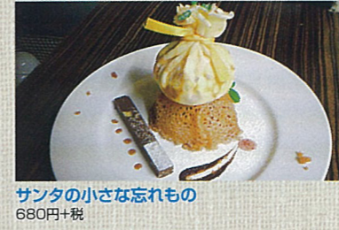
サンタクロースの忘れもの ローリー・ムーア 著 / 古屋美登里 訳 網中いづる 絵 新潮社 680円+税 サンタの小さな忘れもの 680円+税