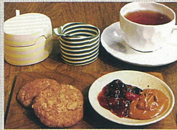
ムーミンママのお料理の本 ムミンママの手作りクッキー 木の葉のジャムとピーナッツバター添え ヤンソン,T 著 / マリス,S 著 / 渡部 訳 講談社 400円+税(単品) 650円+税(ドリンク付)