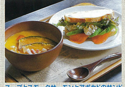
パンとスープとネコ日和 群像文庫 スープとスモークサーモンとアボカドのサンド 1,000円(税込)