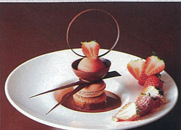
チョコレート工場の秘密 ロアルド・ダール 作 / クロティン・ブレイク 絵 柳瀬尚紀 訳 評論社 温かいチョコレートのデザート フランボワーズのソルベ 14:30～17:30のみ販売します 1,500円(ドリンク付)(税込)