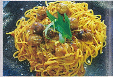
ディズニースーパーゴールド 絵本 わんわん物語 文福川祐司 講談社 レディーにささげるアルデンテ生パスタ 千屋牛肉100%ミートボールがのった生パスタ 1,200円+税