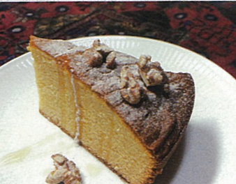
おばあちゃんだいすき 葉 祥明 至光社 はちみつケーキ 378円(税込)