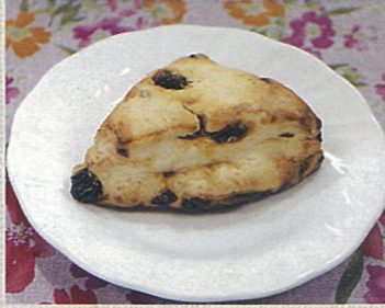
きつねとぶどう 坪田譲治 作 / いもようこ 絵 金の星社 ほしぶどうのスコーン 130円(税込)