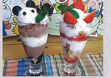
どうぶつむらしかけ絵本 おいしいよ やぎのケーキやさん きむらゆういち 作・絵 偕成社 やぎさんのフルーツパフェ 各650円(税込)