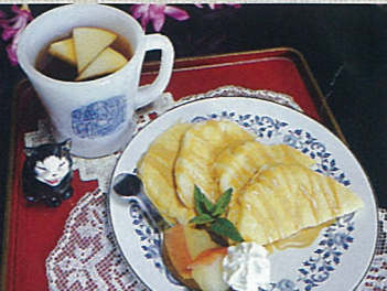
アップルソング 小手鞠るい ポプラ社 オーチャードティーとアップルソースのパンケーキ 650円(税込)